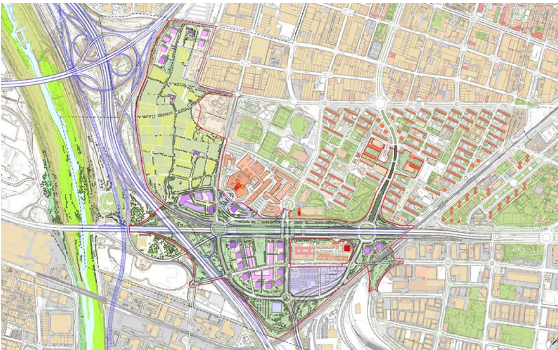
Ordenació proposada a l'àmbit del PDU Granvia-Llobregat.

A grans trets, el PDU preveu la creació i consolidació del gran parc de Cal Trabal, la creació de teixit urbà allà on ara hi ha buit, i la definició de pols d'activitat econòmica aprofitant la posició estratègica de l'àmbit i l'existència de dos centres hospitalaris de referència. Tot això, garantint una continuïtat urbana coherent amb l'anterior tram reformat i exclouent l'ús residencial.